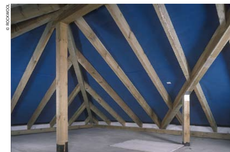
Poddasze typu nieszczelnego dla pary wodnej

Jeżeli wykonaliśmy więźbę dachową pod pokrycie dachowe z dachówki ceramicznej (betonowej) lub blachodachówki, to przed przybiciem kontrłat i łat musimy przymocować do górnej powierzchni krokwi (np. zszywkami) folię paroprzepuszczalną. Folia ta jest dodatkowo mocowana kontrłatami, czyli listwkami grubości 2–3 cm przybijanymi wzdłuż krokwi. Przy elementach takich jak okna dachowe czy elementach wystających ponad powierzchnie dachu (np. kominy) ważne jest prawidłowe ułożenie folii, aby zapobiec przedostaniu się deszczu i śniegu. Po wykonaniu już właściwego pokrycia dachu w postaci np. dachówki lub blachodachówki możemy przystąpić do montażu ocieplenia połączy i stropu nad poddaszem użytkowym. Dokonujemy pomiaru rozstawu w świetle między krokiewiami, następnie docinamy płyty lub maty z wełny mineralnej o 2 cm dłuższe