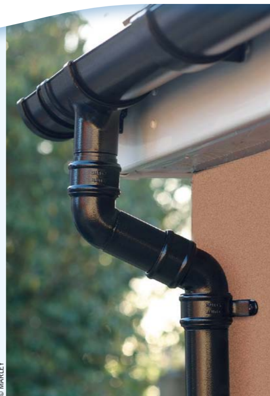
Fot. 1. Fragment systemu rynnowego: rynna dochodząca do leja spustowego, od którego biegną kolanka połączone rurą króćcową oraz rura spustowa

W grupie systemów rynnowych metalowych obecne są wyroby wytwarzane z blach miedzianych, stopów tytanowo-cynkowych, aluminiowych oraz uszlachetnionych stali ocynkowanych. Ich zaletą jest znaczna odporność na warunki atmosferyczne, promieniowanie UV i wpływy środowiska. Różnią się między sobą trwałością, stopniem trudności