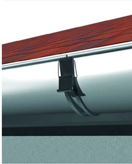
Fot. 2. Fragment rynny przymocowany do deski czołowej obejmą, czyli tzw. rynhakiem

Na nowym budynku systemy rynnowe mogą być mocowane po wykonaniu więźby dachowej i obrobieniu deski czołowej. Przy wymianie istniejącego orynnowania może być konieczny demontaż lub poluzowanie utrudniających montaż obróbek blacharskich i elementów pokrycia dachowego. Prace takie wykonuje się w sprzyjających warunkach atmosferycznych na ustawionym bezpiecznym rusztowaniu. Przy montażu systemów