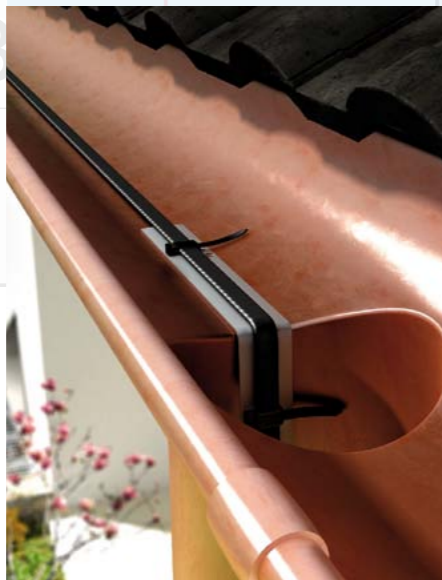
Fot. 3. Fragment zainstalowanego systemu antyoblodzeniowego.

Rynny montuje się na rynhakach (fot. 2), uchwytach rynnowych mocowanych do deski okapowej, krokwi lub pokrycia dachu w sposób, który wykluczy narażenie ich na uderzenie zsuwającego się z dachu śniegu (poniżej linii spadku dachu). Gdy konstrukcja dachu nie pozwala na taki montaż, trzeba zamontować bariery śniegowe. Żeby przy dużych opadach zapobiec przelewaniu się wody ponad rynną, okap nie powinien być wysunięty dalej niż połowa średnicy rynny.